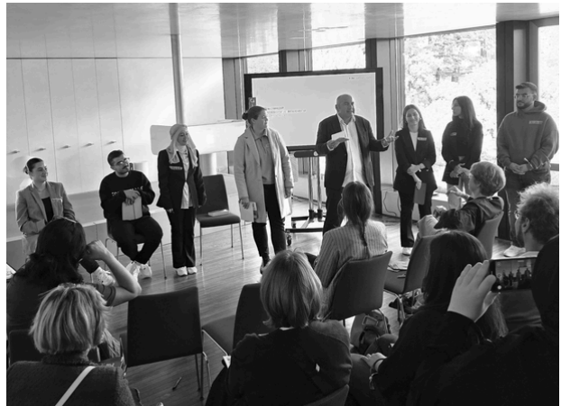
Vortrag bei der Schaderstiftung, 12. September 2025

Im Rahmen des Tages der Architektur 2026 präsentiert der Fachbereich Architektur der Hochschule Darmstadt (h_da) ein interdisziplinäres Realisierungsprojekt. Die Ausstellung verfolgt ein klares Ziel: Sie will die Öffentlichkeit nicht nur über die Not der Waisenkinder in Syrien informieren, sondern einen konkreten, architektonischen Lösungsweg aufzeigen und die notwendige Unterstützung für dessen Realisierung mobilisieren.