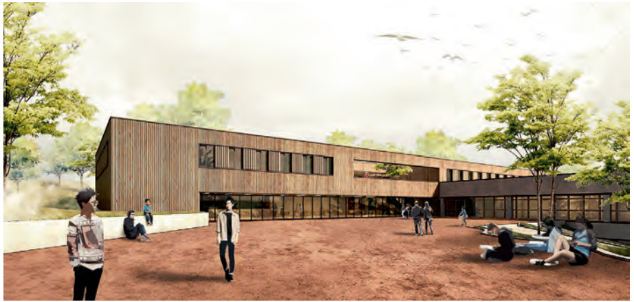
3. Preis: Bär, Stadelmann, Stöcker Architekten und Stadtplaner PartGmbH, Nürnberg

Mit einem dritten Preis wurden Bär, Stadelmann, Stöcker Architekten und Stadtplaner aus Nürnberg bedacht. Ihr Entwurf sieht einen kompakten, zweigeschossigen Holzbau mit Holz-Beton-Verbunddecken vor. Der Eingang und die Achse des Foyers bleiben unverändert. Unmittelbar daneben befinden sich die sechs Verwaltungsbüros; im nordwestlichen Bereich die Mensa. Über ein zentrales Treppenhaus gelangt man zu den beiden, qualitativ jedoch unterschiedlichen Clusterbereichen im ersten Obergeschoss. Der nordwestliche erhält einen zusätzlichen Außenlernraum auf der Terrasse, der andere nicht. Überarbeitungsbedarf sah das Preis-