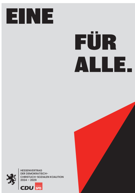
Koalitionsvertrag zwischen CDU und SPD für die 21. Legislaturperiode 2024 – 2029

Der Koalitionsvertrag EINE FÜR ALLE enthält viele grundsätzliche Aussagen und Zielsetzungen, die zahlreiche Schnittmengen zu den Themen der Wahlprüfsteine bzw. darüber hinausgehende Aktivitäten der AKH bilden und Ansätze für die Zusammenarbeit und den politischen Diskurs aufzeigen. Noch sind die jeweiligen Häuser mit dem Auf- und Umbau ihrer Ressorts beschäftigt. In den Gratulationsschreiben an die Minister*innen hat die AKH ihre Gesprächsanliegen bereits adressiert und freut sich auf erste konstruktive Gespräche. □