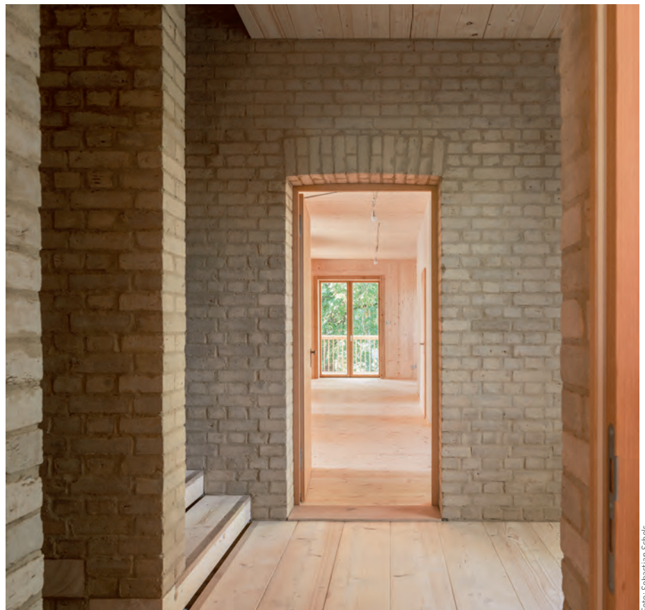
Das vierte Forschungshaus wurde mit Brettstapelholz und Lehmstein gebaut.