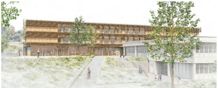
Anerkennung: STUDIO SF Simon Fischer & Architekten GmbH, Mannheim

gericht bei den recht schmalen offenen Lernzonen sowie den Übergängen zum NaWi-Trakt.