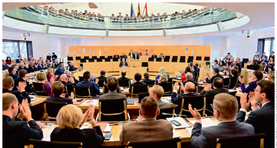
Am 18. Januar 2024 konstituierte sich der neue Hessische Landtag.

Zukünftig soll nach dem Willen der Koalition in den Städten und Gemeinden bezahlbar, nachhaltig, barrierearm und innovativ gebaut werden, unter Berücksichtigung der