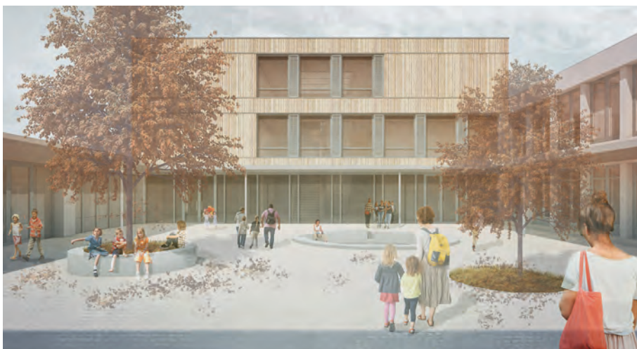
2. Preis: o5 Architekten BDA – Raab Hafke Lang GbR, Frankfurt am Main

derstufe aufbauend vereint sie die weiterführenden Schulformen Hauptschule, Realschule und Gymnasium sowie einen Förder-schulzweig unter einem Dach.