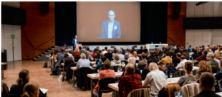
Impression vom Hessischen Brandschutztag 2023