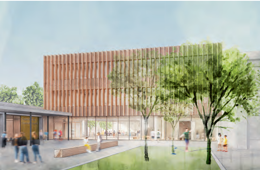
1. Preis: ACMS Architekten GmbH, Wuppertal

D ie Gesamtschule Ebsdorfergrund im Landkreis Marburg-Biedenkopf bietet ein umfangreiches Bildungsangebot. Auf einer För-