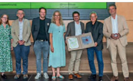
Regenwasserbewirtschaftung - Nachhaltig im Wandel am Campus Lichtwiese, TU Darmstadt TU Darmstadt, Dezernat V

eine fachrichtungsübergreifende, integrierte Planung plädierte, um den immensen aktuellen Transformationsbedarf bewältigen zu können. Die Zielgruppen des Staatspreises, der sich an alle vier Fachdisziplinen Architektur, Innenarchitektur, Landschaftsarchitektur und Stadtplanung richtet, spiegeln dieses