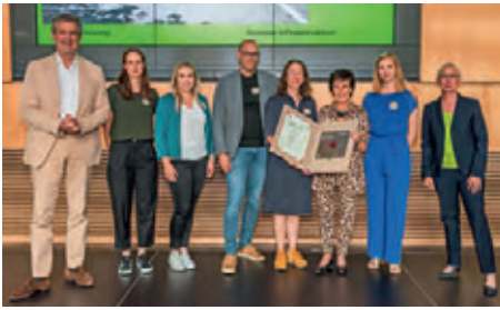
Sport- und Bildungscampus Bürstadt prosa Architektur + Stadtplanung BDA | Quasten Rauh PartG mbB, Darmstadt