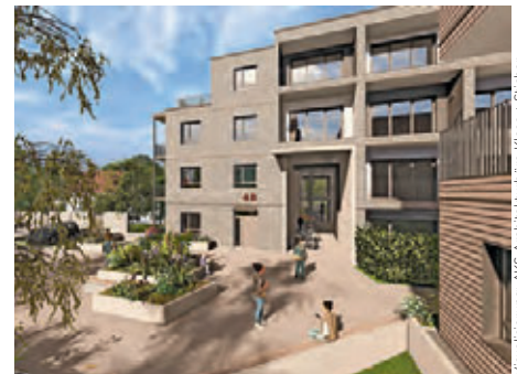
Holzmodulbau in Kriftel: Blick über den Quartiersplatz

Darüber hinaus prämiiert der GFB-Zukunftspreis das kommunal bedeutsame Pilotprojekt der sozialen Wohnanlage Kriftel in serieller Holzmodulbauweise mit sortenreinen revidierbaren Baustoffen, begrünten Dachflächen und der