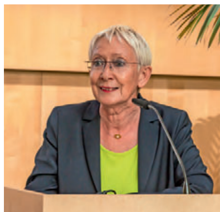
Kammerpräsidentin Brigitte Holz betonte die Bedeutung nachhaltiger Planungen für den gesellschaftlichen Zusammenhalt.