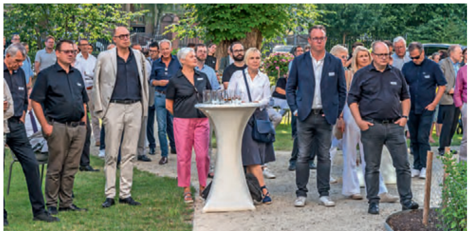
Interessierte Zuhörer*innen während der Podiumsrunde.

Für Förster-Heldmann gab es „keinen Königsweg, um die Transformation zu bewältigen“. Sie warb unter Beifall aus dem Publikum dafür, Planenden die Freiheit zu geben, Innovationen umzusetzen, denn „nur wenn wir zulassen, dass Dinge ausprobiert werden, kommen wir zu Zielen“.