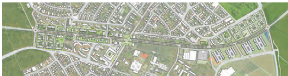
3. Preis: H. Gies Architekten GmbH, Mainz mit Pfrommer + Roeder Freie Landschaftsarchitekten BDLA, Stuttgart

ner (Stuttgart) und Freiraum+Landschaft (Nürtingen) prämiert. Die Verfasser*innen entwickeln einen „konsequenten und visionären Gegenentwurf zum Bestand“, der der Innenentwicklung und Qualifizierung der Freiräume gleichermaßen gerecht wird, so die Jury. Der Entwurf unterscheidet in einen baulich gefassten Stadteingang im Nordwesten und einen landschaftlichen Stadteingang im Osten. Die rückgebaute Bundesstraße wird als neuer Bewegungsraum gestaltet: Vom Stadtboulevard mit mittiger Grünachse und Radweg im Nordwesten über einen Platz mit Bibliothek, Café und offener Halle an der Gathof-Kreuzung bis hin zum Stadtboulevard mit seitlichen Rad-Fußwegen im Südwesten. Auf Zustimmung stieß auch das Verkehrs- und Mobilitätskonzept, das neben Radwegeverbindungen und dezentralen Quartiersgaragen einen autonomen Ringverkehr vorsieht.