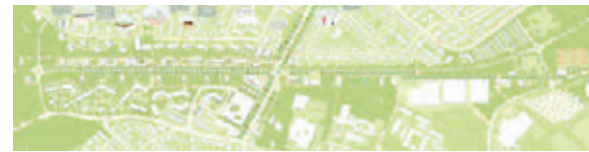
Anerkennung: Gräf Architekten GmbH, Kaiserslautern & Hofmann Röttgen Landschaftsarchitekten BDLA, Limburgerhof