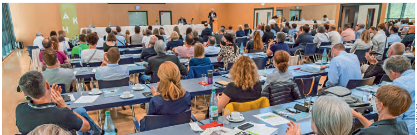
Impression vom Vergabetag 2022

Die AKH veranstaltet den Hessischen Vergabetag in Zusammenarbeit mit dem Hessischen Landkreistag, dem Hessischen Städtetag und dem Hessischen Städte- und Gemeindebund.