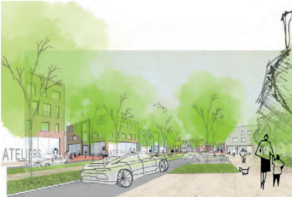
2. Preis: mharchitekten GmbH | Freie Architekten und Stadtplaner, Stuttgart mit Freiraum+Landschaft, Nürtingen