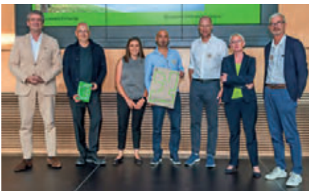
Mensa und Mediathek Berufsschulzentrum Nord, Darmstadt wulf architekten gmbh mit Jetter Landschafts- architekten, beide Stuttgart