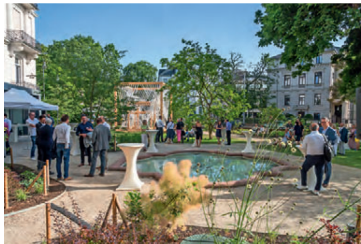
Der Kammergarten bot Raum für Kennenlernen, Austauschen und Vernetzen.