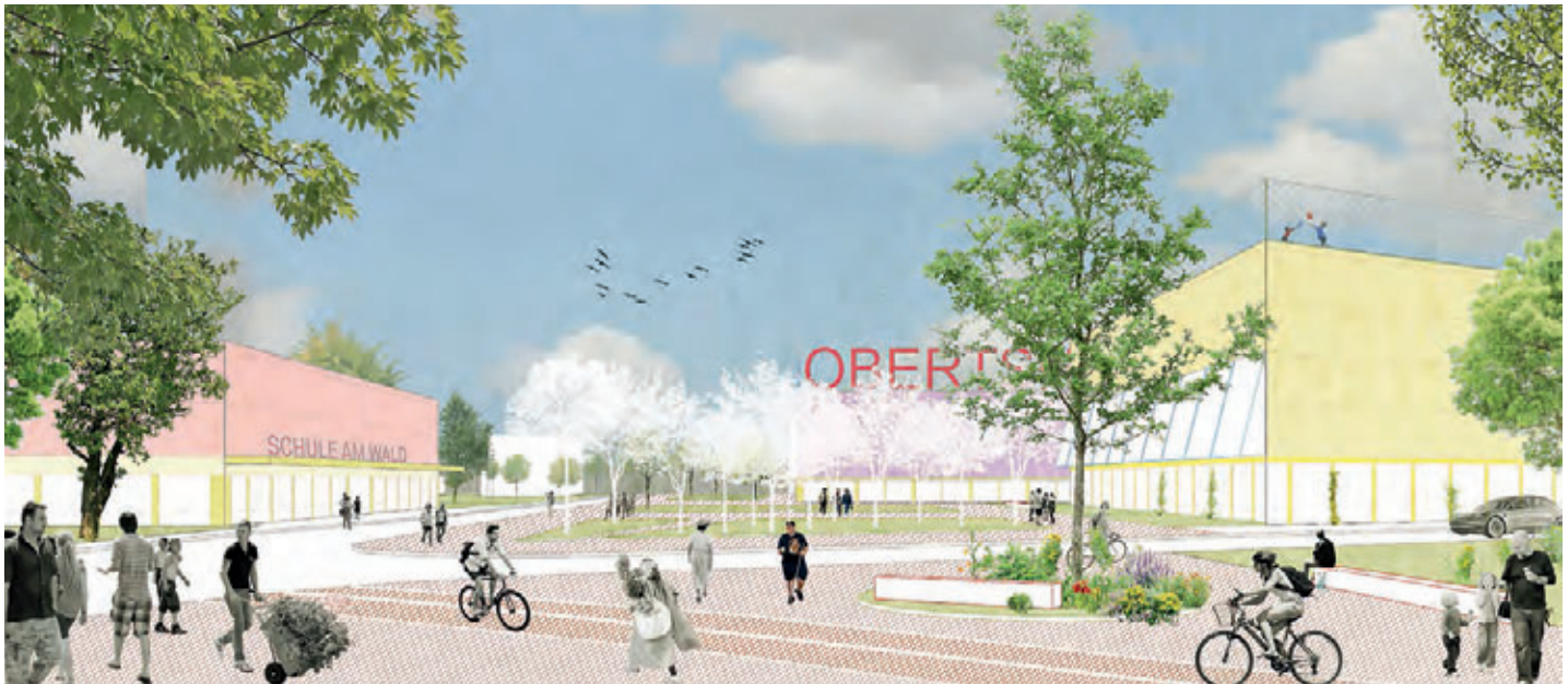
1. Preis: rethmeierschlaich architekten PartG mbB, Köln mit Rabe Landschaften, Hamburg

Die südhessische Stadt Obertshausen im Landkreis Offenbach besteht aus den Stadtteilen Hausen und Obertshausen, die durch die Bundesstraße B448 getrennt werden. Unter dem Motto „Sieben auf einen Streich“ sollen die beiden Stadtteile stärker miteinander verknüpft und ein zentraler mittlerer Stadtbereich entwickelt werden. Neben dem Rückbau der vierspurigen Bundesstraße hin zu einer zweispurigen Stadtstraße ist die Schaffung von Wohnraum und ergänzenden Einrichtungen durch innerstädtische Nachverdichtung sowie die Stärkung des Fuß- und Radverkehrs gewünscht. Das Wettbewerbsareal umfasst rund 19 Hektar; die an die Bundesstraße angrenzenden Flächen befinden sich überwiegend in städtischer Hand. Gestaltungsvorschläge lieferte nun ein offener zweiphasiger Realisierungswettbewerb mit Ideenteilen, der von BÄUMLE Architekten | Stadtplaner aus Darmstadt betreut wurde.