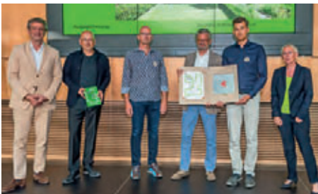
Übernachtungsstätte für Obdachlose im Ostpark, Frankfurt am Main hks | architekten GmbH, Erfurt