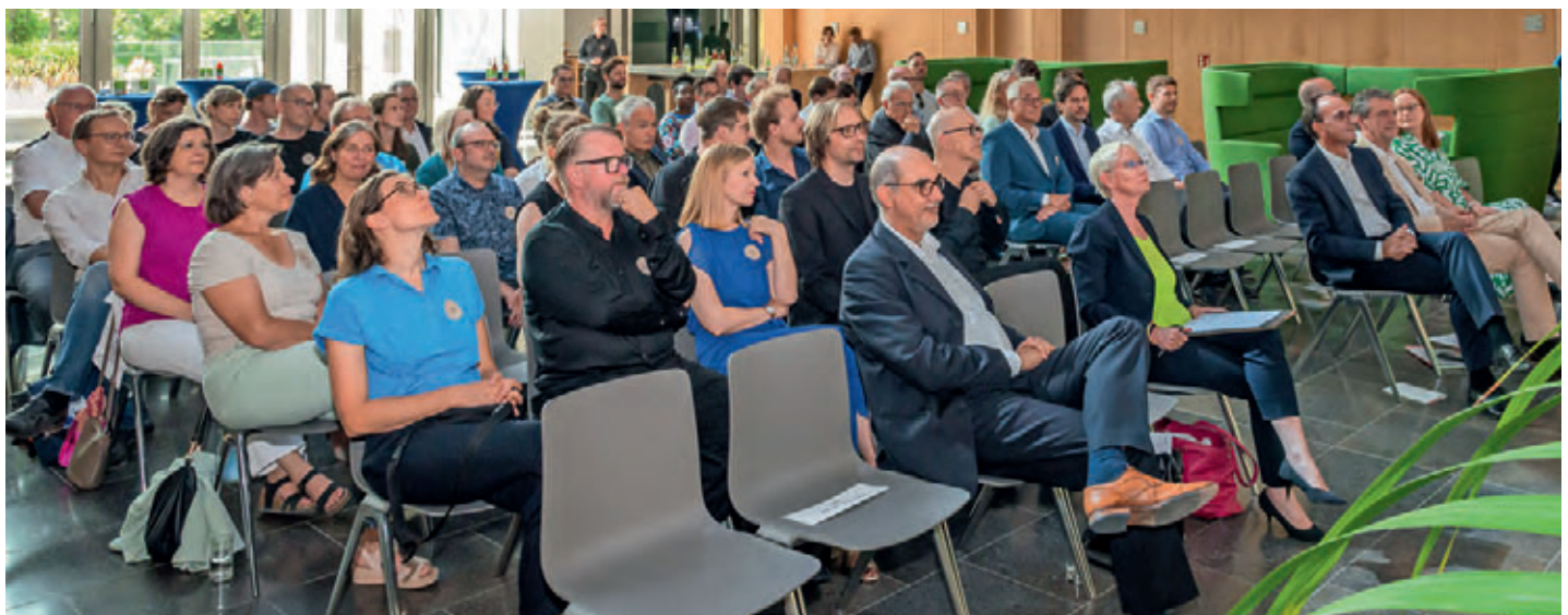
An dem Festakt nahmen Planer*innen und Bauherr*innen der ausgezeichneten Projekte teil.