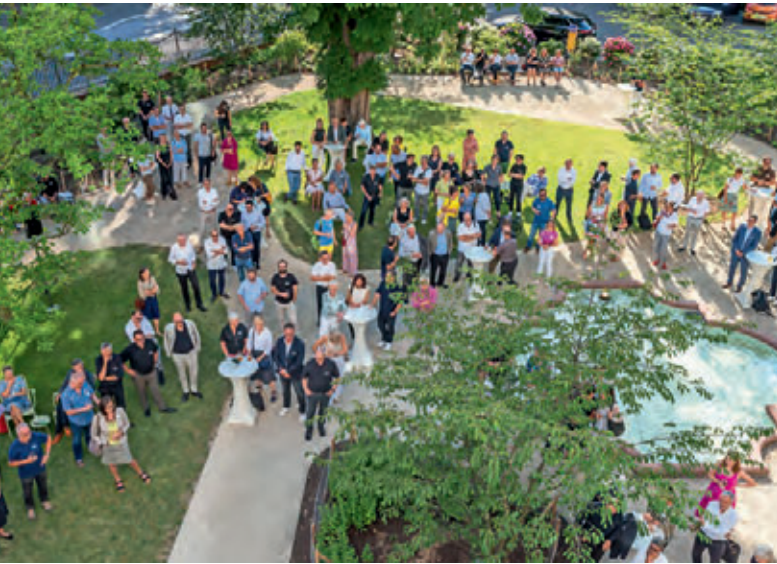
Blick vom Vorstandszimmer auf den Garten der Kammer

Die Rolle der Politik sah Müller darin, „sich um die Probleme [zu] kümmern und Leitplanken und Ziele zu setzen. Mehr jedoch nicht. Es gibt unterschiedliche Lösungsansätze. Die Politik hat die Aufgabe diese Lösungsvorschläge zu bewerten und umzusetzen“.