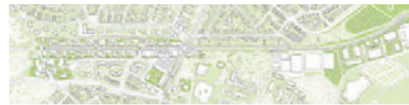
Anerkennung: kama architekten balsen | filipovic partG mbB, Frankfurt am Main mit GTL | Michael Triebswetter Landschaftsarchitekt, Kassel