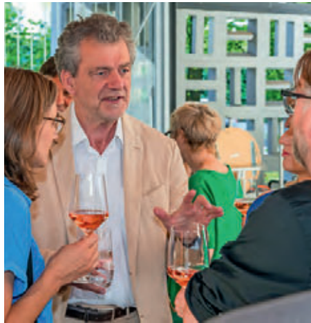
Der Festakt bot viele Anregungen für weitere Gespräche.

Dort kann auch das Sustainability Paper 4 als PDF-Datei heruntergeladen werden. Über die