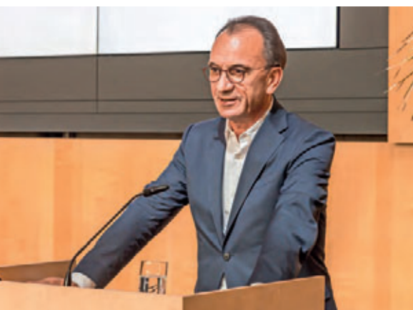
Der Hessische Finanzminister Michael Boddenberg definierte den Staatspreis als Teil der Nachhaltigkeitsstrategie des Landes.